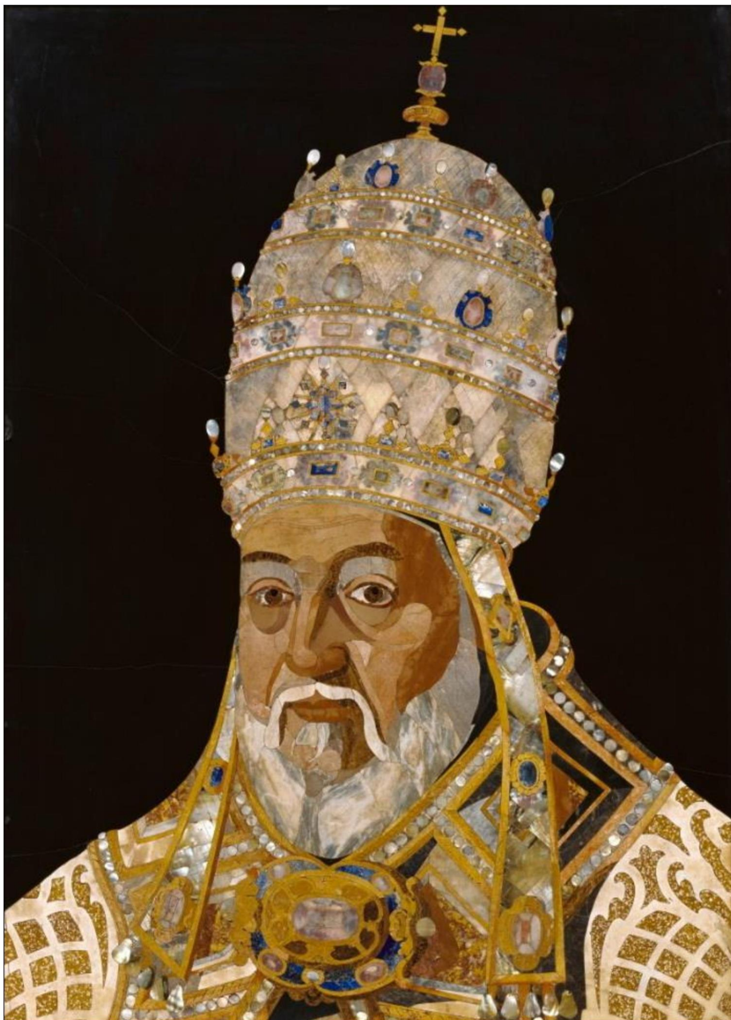
Papež Klement VIII. se narodil na den sv. Matěje 24. 2. 1536 ve Fano v Itálii jako Ippolito Aldobrandini. 30. 1. 1592 byl zvolen 231. papežem. Umírá 3. 3. 1605.