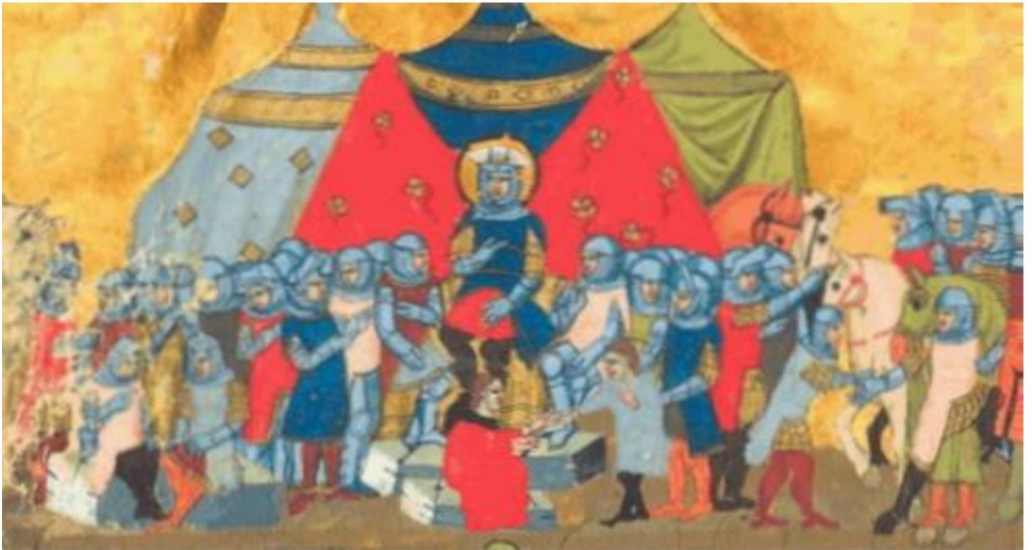
↳ Setkání knížete Václava s kouřimským knížetem Radslavem †

povraždění, ženy a děti prodány do otroctví. Ruiny města spáleného na popel celá desetiletí zarůstaly plevem a bodláčím. Jenom na dně přístavu trpělivě čekal kov – slitina ze všech soch a nádobí, kování, mincí, zbraní či okovů – které se v době požáru změnilo v potůčky rozžhaveného kovu. Už ve starověku se tato slitina, které se říkalo „ korintská měď “ stala vzácnou, nad zlato ceněnou surovinou. 1024 let poté, co ztuhnula korintská měď , zažívalo libické hradiště vskutku dějinnou událost. Český kníže Bořivoj se spolu se svojí ženou Ludmilou nechal pokřtít od velkomoravského biskupa Metoděje . Psal se rok 871 a kněžna Ludmila obdržela při té příležitosti kovový, z korintské mědi vyrobený obrázek Panny Marie s malým