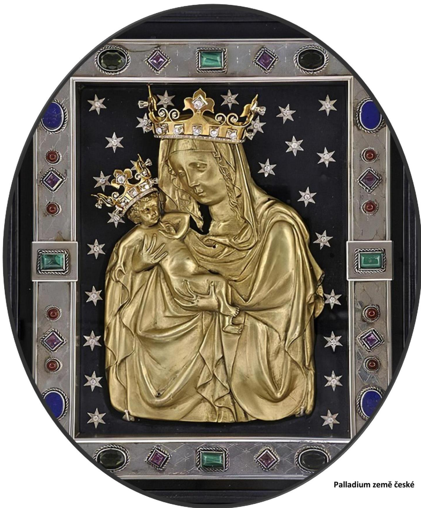
Palladium země české

Legendy uvádějí, že k vraždě knížete Václava došlo na sídle Václavova bratra Boleslava – (Staré) Boleslavi 28. září 935 . Rok to mohl být dle některých legendistů či historiků jiný, ale vše ostatní se zdá, že bylo právě tak. Důvodem měla být oslava svátku svatých Kosmy a Damiana . Těmto světcům byl zasvěcen kostel, který stál na Boleslavově hradišti. Notoricky známá vražda, ke které došlo ráno 28. září , mohla mít ovšem ještě jiný motiv, než Boleslavovo náhodné vzplanutí hněvu dané přemírou alkoholu předchozí noci a zlé našeptávání jeho okolí. To vše se mohlo a