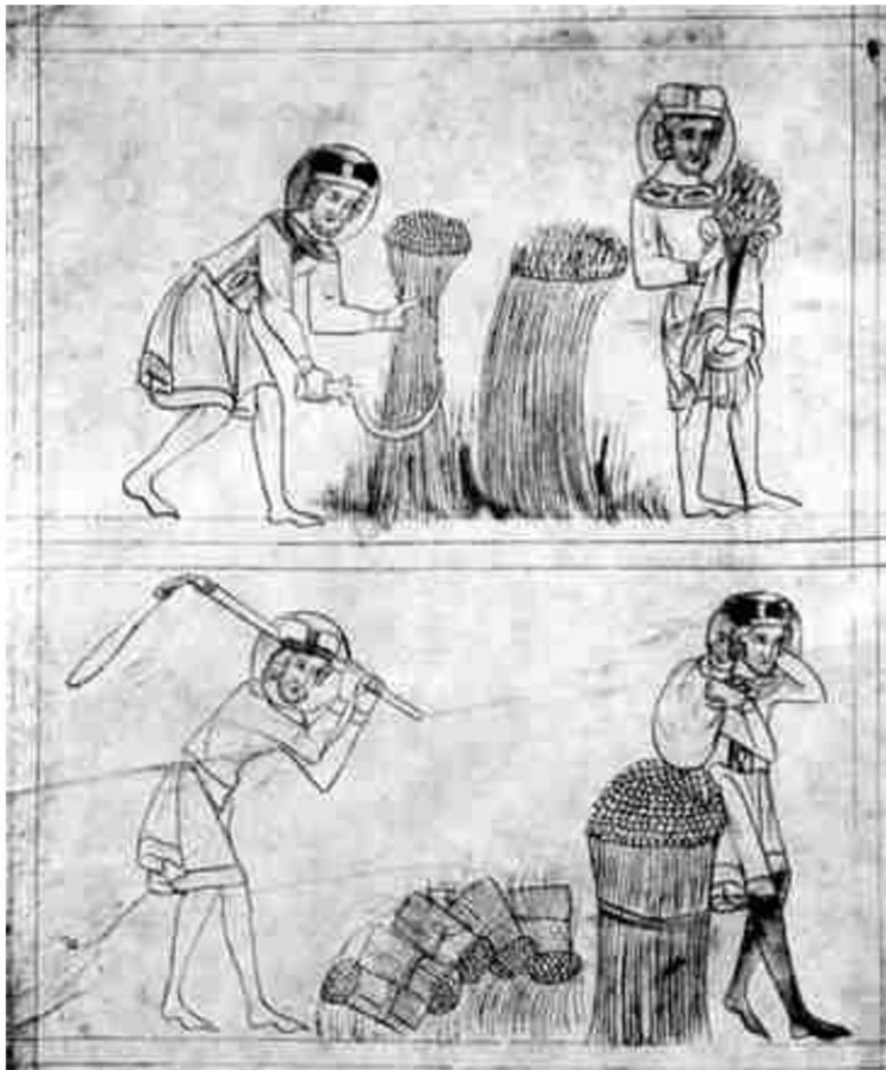
Svatý Václav a jeho věrný sluha Podiven .

pravděpodobně i podepsalo na Boleslavově rozhodnutí zbavit se svého knížecího bratra. Jenže tou skutečnou příčinou mohlo být posílené sebevědomí – vždyť se mu právě toho dne – a mohlo to být ještě před vraždou čili časně zrána – narodil po Boleslavovi II. další syn jenž do dějin vstoupil pod jménem Strachvas . Zpráva o narození syna musela mít pro Boleslava naprosto zásadní význam a vyvolat v něm celou symfonii emocí. Vedle hrdosti na otcovství a spokojenosti, že mu Bůh dozajista přeje, musel Boleslav přemítat i reakci knížete Václava na tuto novinu. Bylo v duchu oněch časů zvaných „temné století“, že se potenciální uzurpátoři trůnu vyvražďovali. Boj o moc nad celou zemí byl často krutý a na vládnoucí trůn či stolec málokdy usedlo více osob než jedna. A pokud se tak stalo – jako tomu bylo v případech regentství za nezletilé následníky – věci často nabíraly nečekaný a tragický spád. Svatá Ludmila by mohla vyprávět. Proto to mohly být tyto obavy, které vedly Boleslava k prudké reakci a bratrovraždě.