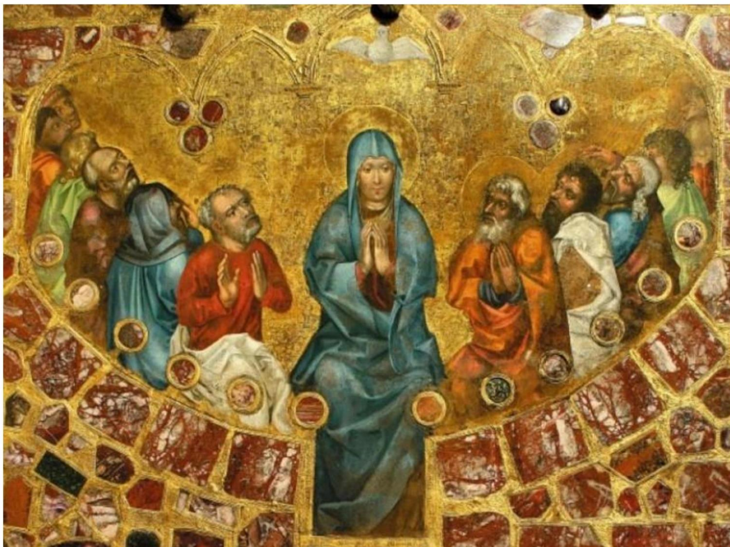
Freska sv. Ludmily z katedrály sv. Víta

Ježíškem v náručí. Pravděpodobně se jednalo o osobní dar doplňující předání vzácného bohoslužebného nádobí z téhož materiálu. Legendy se o této události v jednotlivých detailech rozcházejí, ale jejich gró zůstává stejné: Ludmila obdržela vzácný dar – budoucí Palladium země české . Poté, co se na Tetínském hradišti odehrála její vražda, Palladium zdědil její vnuk – kníže Václav . Dle legend jej nosil stále u sebe a roku 922 je měl zavěšené na krku, když mělo dojít k legendární bitvě u Kouřimi . V ní se střetl s odbojným knížetem Radslavem , vůdcem zlického lidu. Legendy popisují zázrak, který se toho dne na bojišti udál. V momentě, kdy se už schylovalo k bitvě, zaleskl se kříž na Václavově helmici a zraku Radslavově nezůstalo skryto ani Palladium , které měl kníže zavěšené na krku. To byly jasné atributy spojenectví Václava s dalšími křesťanskými panovníky a Přemyslovcovo vyvolení od Boha. Zlický kníže si v ten okamžik mohl snadno spočítat, že je rozumné upustit od války s křesťanským knížetem a vyhnout se tak tomu, aby on sám byl označen