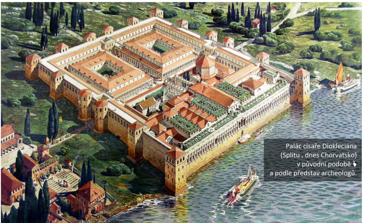
Palác císaře Diokleciána (Splitu, dnes Chorvatsko) v původní podobě a podle představ archeologů.

Císař Dioklecián se, žel bohu, neproslavil svými velkolepými stavbami, jak by dozajista rád, nýbrž fanatickou nenávisť ke křesťanům, které pronásledoval, mučil a trýznil, jak jen to šlo. Naprostého státnického nonsensu se z lidského i historického úhlu pohledu dopustil kolem roku 307 . Krátce před tím se totiž dle legend do Říma dostal učitel Modestus , kojná Crescencie [Krescencie] a jejich svěrenec Vít . Vít byl tehdy ve věku, kdy naše děti chodí na základní školu. Uvádí se, že mu bylo buď