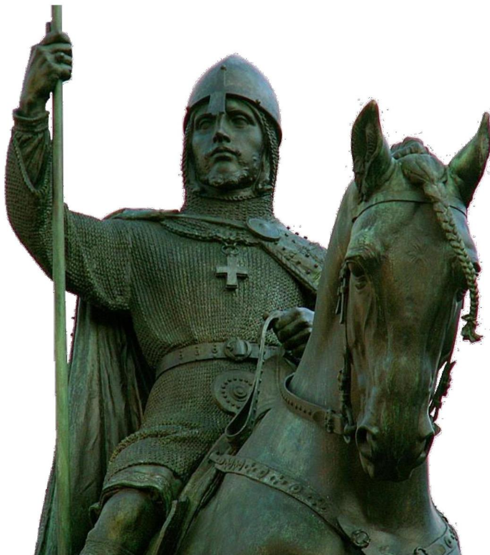
Svatý Václav hlavní patron české země

Christianizace Čech i snaha o jejich podmanění stavbou rotundy sv. Víta neskončila. Zato životní úděl nejpřednější českého světce se pomalu chýlil ke svému dramatickému konci. Tragicky vyvrcholený spor mezi Václavovou matkou Drahomírou ze Stodor , jež byla saského původu, a babičkou Ludmilou , nenechal stranou ani dalšího člena Přemyslovské rodiny – budoucího knížete Boleslav I. Ten v dětství vyrůstal společně se svým bratrem na hradišti v Budči . Dostalo se mu tudíž jak skvělého vzdělání, tak i vhledu do významu křesťanství pro prestiž a budoucnost celého knížectví. Po smrti Ludmily a bratrova nástupu na knížecí stolec to byl právě Boleslav , kdo se stal útočištěm pro svoji pohanskou matku Drahomíru . A jak ubíhaly roky, mezi sourozenci rostly i rozdíly v přístupu ke správě knížectví. Není pravděpodobné, že by Stodoranka Drahomíra radikálně změnila postoj ve věci přístupu k německým sousedům, a tak je nanejvýš pravděpodobné, že ve svém druhém synovi viděla lepšího vládce než v Ludmilině oblíbenci Václavovi . Vždyť ten se uvolil platit ohromné výkupné Bavorům , kteří se mu odvděčili pouhým kusem kosti.