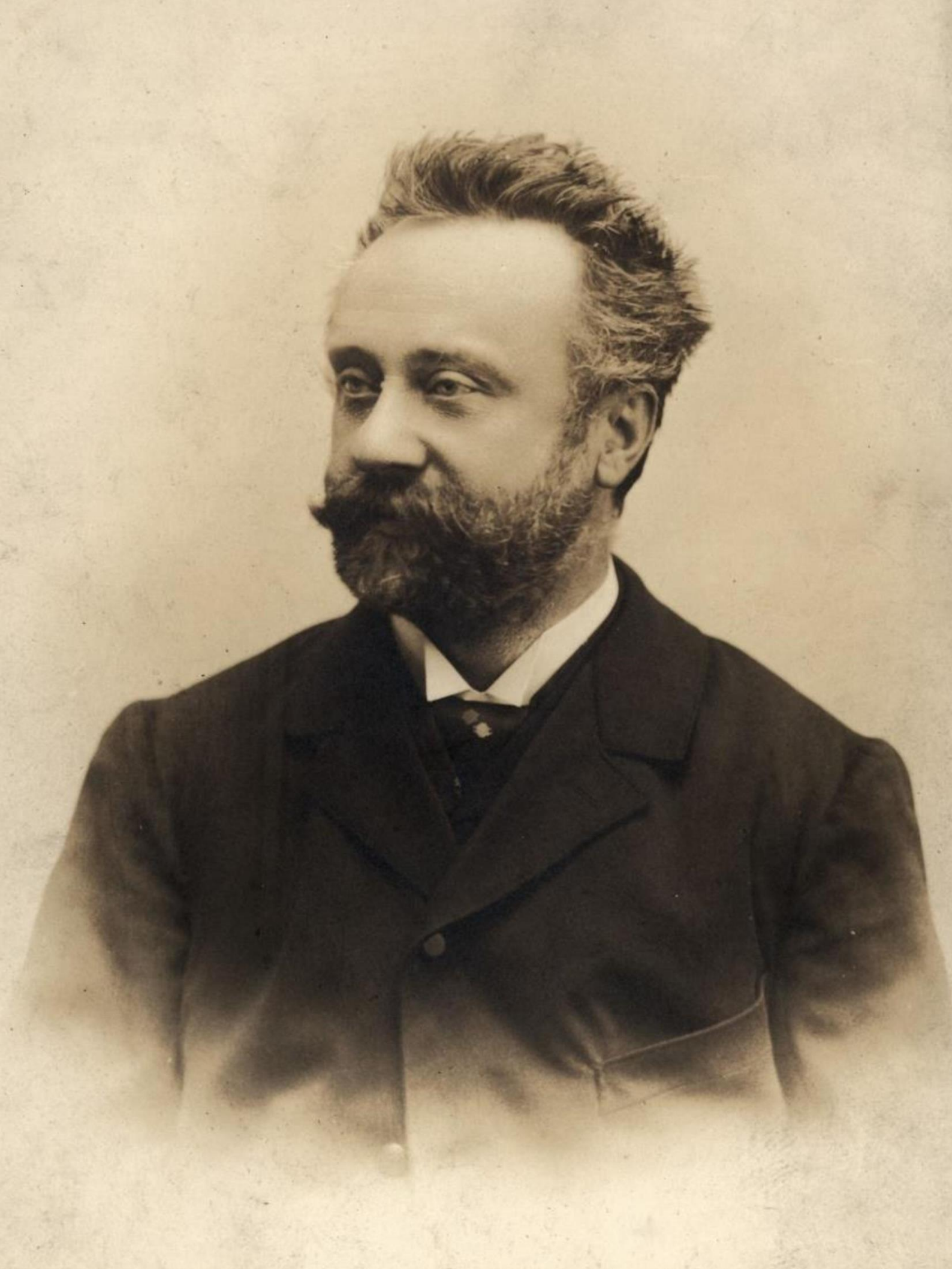
Zikmund Winter (1846–1912)