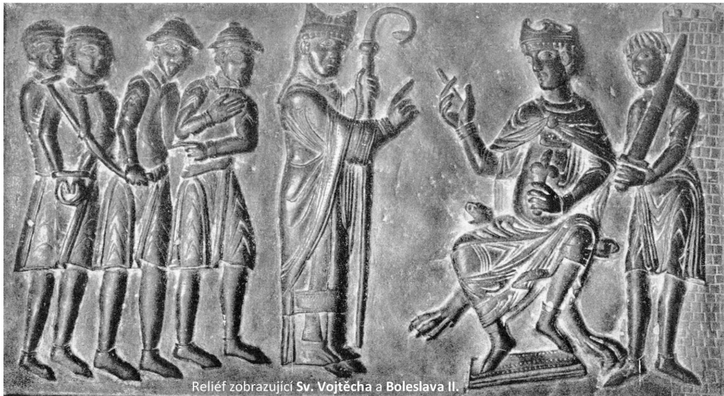
Reliéf zobrazující Sv. Vojtěcha a Boleslava II.

nejednalo a kníže Boleslav II. Pobožný dal v lesích nad Šáreckým údolím a na dohled starobylého slovanského hradiště „ Džbán “ vystavět pouhý dřevěný kostelík. Ať už se jednalo o dřevěnou či kamennou stavbu, byla to stavba dokazující vůli Čechů býti dobrými křesťany a národem hodným vlastního biskupa. Vždyť téhož roku byla založena naše nejstarší a dodnes existující organizace – Metropolitní kapitula dříve zvaná Svatovítská. Jejím prvotním posláním bylo zbudování mocného pilíře české státnosti – pražského biskupství. A tento cíl se dva roky po založení kapituly úspěšně zadařil.