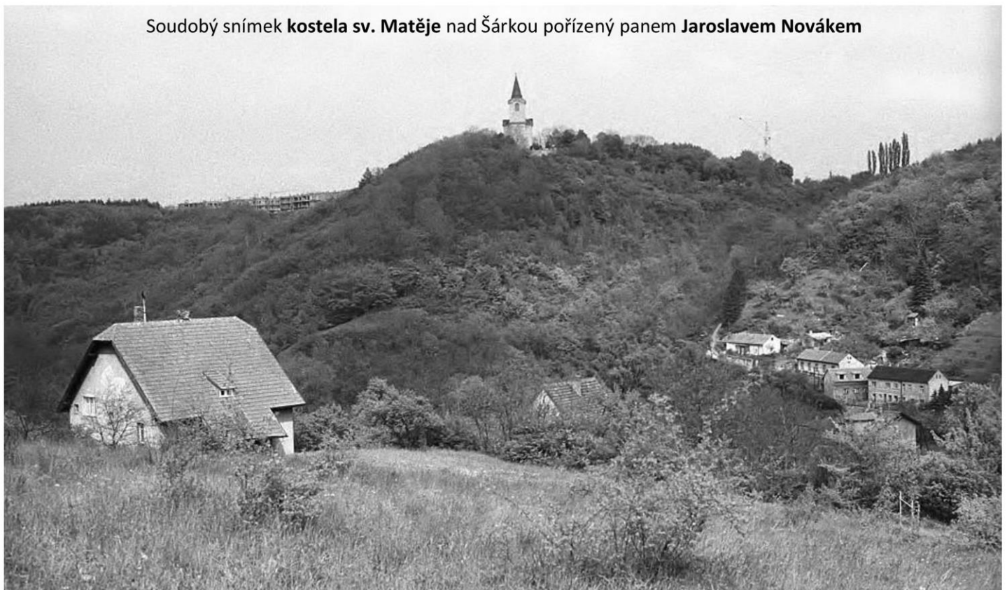
Soudobý snímek kostela sv. Matěje nad Šárkou