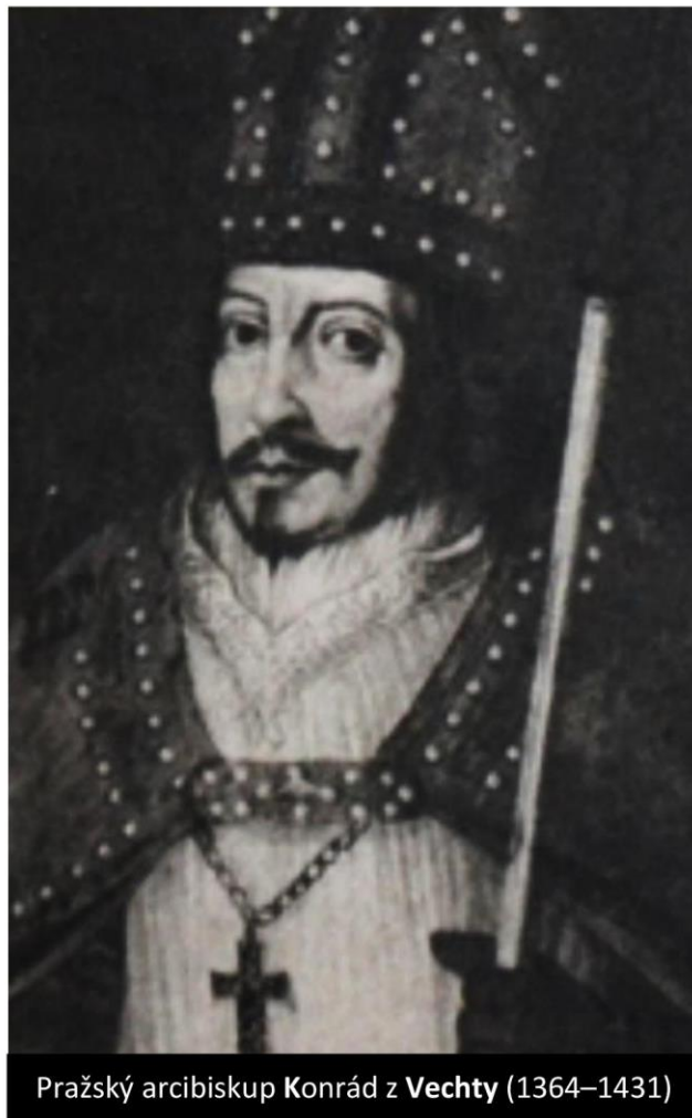
Pražský arcibiskup Konrád z Vechty (1364–1431)

Svéráz doby dobře vystihuje Zikmund Winter : „Jeden užitek ze své chudoby kapitola měla; přestal totiž škodlivý prastarý zvyk papežských provisií; papežové za provise již nikomu neudělovali kanovníckých praebend zámeckých, nebyloť kupců, kteří by za malé důchody mnoho chtěli platiti. Tím získala kapitola svobodnou volbu svých členů; konsil basilejský roku 1437 dal jí právo volně se doplňovati, ač zmíniti se dlužno, že v XV. věku i s první půli XVI. věku leckdy administrátor in spiritualibus jmenoval kanovníky sám. Dosazení či instalaci provedl děkan kapitulní tím starodávným způsobem, že uvedl nového kanovníka na místo v kůru (stallum); kapitulárové ho přijali mezi sebe políbením. Druhdy jen kanovník králův a královnin býval praesentován od krále.“